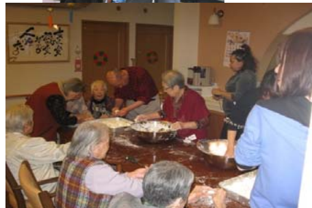
餅つき・みんなで丸めました。