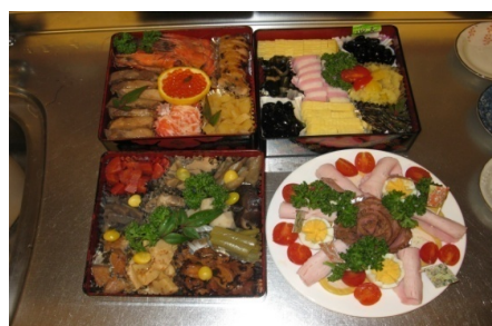
お正月 『おせち料理』