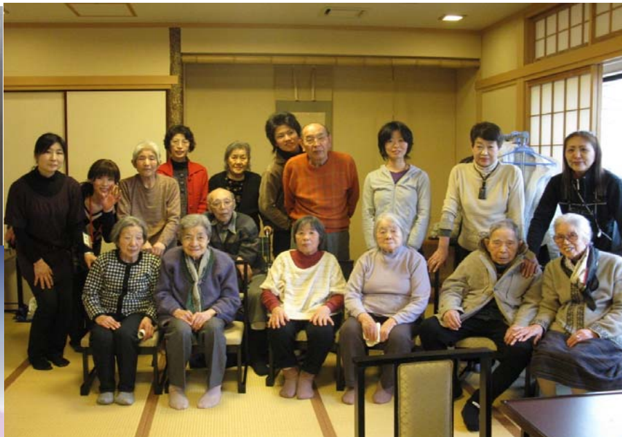
「新年会」 大津 疏水亭に行きました。