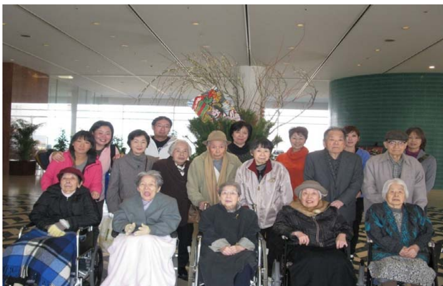
「新年会」 琵琶湖ホテルに行きました。