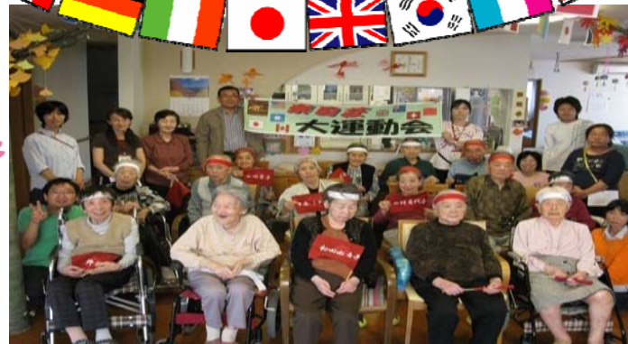
秋の大運動会 皆様、大活躍でした。