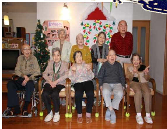
クリスマス会 楽しく歌を唄いました。

新年明けましてあめでございます。 今回は、敬老会から1月までのほんわか通信をお届けします。 本年もどうぞ宜しくお願い致します。