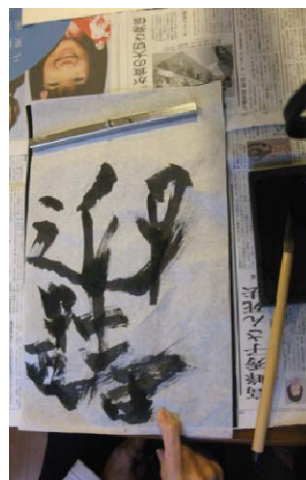
平成23年 書き初め 『迎春』